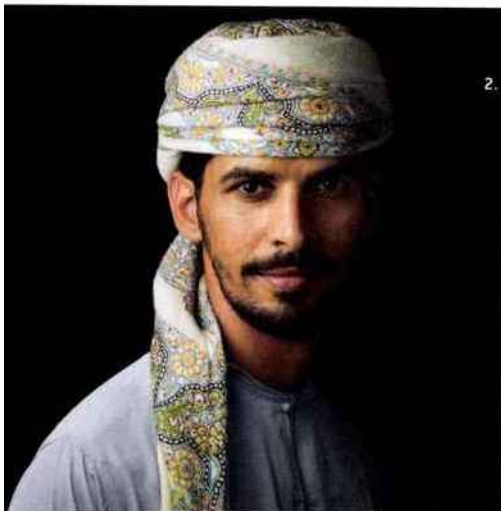
1. La Bouhinia 2. Oman, Portrait 1

LE MUSÉE NATIONAL DES ARTS ASIATIQUES GUIMET COLLABORE AVEC LE SHANGRI- LA HÔTEL, PARIS.